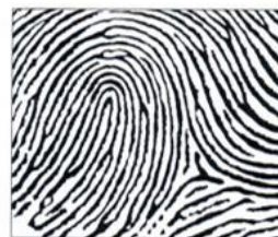
4. Radiální smyčka