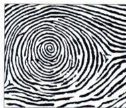
6. Spirální závít

Podívej se na dermatoglyfy po stranách. Který se nejvíce shoduje s tvým? Spoj čarou.