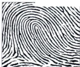
1. Ulnární smyčka

Natři si jednotlivé prsty inkoustem a udělej si jejich otisk. Co jsi zjistil?